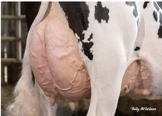
WESTCOAST ALCOVE RIZA 7512